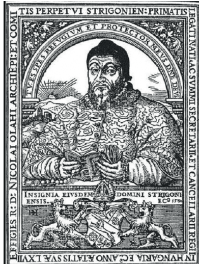
Figure 1. Archbishop Miklós Oláh