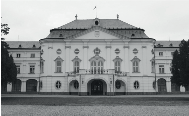
Figure 2. The former Episcopal Summer Palace