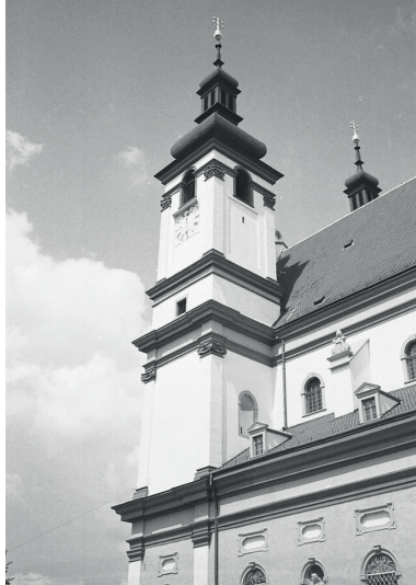
Figure 5. Saint Joseph Church in Nagyszombat

Összefoglalva a levéltári és szakirodalmi forrásokból nyert kutatásainkat, Lippay János életútja a következő időszakkal mutatható be: