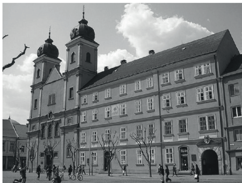
Figure 4. Piarist Church of St. Francis Xavier (Trencsén)