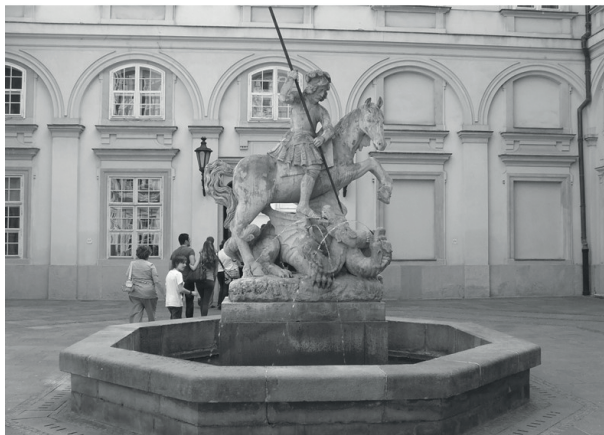
Figure 6. The statue of Saint George

6. ábra. A titokzatos eredetű Szent György-szobor